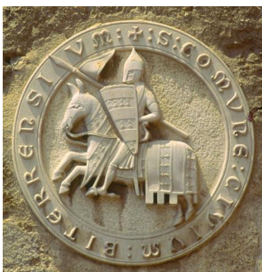
Sceau de Trencavel

Depuis Lyon des péniches avaient transporté les vivres, le matériel de guerre et les hommes. Elles débarquent début juillet 1209 à Saint-Gilles. Aussitôt la troupe se met en marche en empruntant la voie Domitienne. Après une halte à Montpellier qui avait ouvert ses portes aux croisés et une dernière négociation infructueuse entre Arnaud Amaury et le seigneur le plus important du pays : Raymond-Roger de TRENCAVEL, vicomte de Carcassonne, Béziers, Agde, Albi et Razès, la troupe se remet en marche.